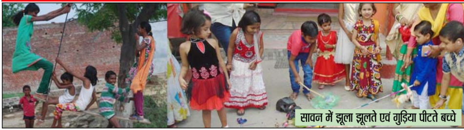
सावन में झूला झूलते एवं गुड़िया पीटते बच्चे

कई स्थानों पर लगे मेले, जमकर हुई खरीदारी, लोगों के घरों में बने पकवान