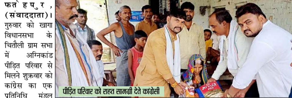
पीड़ित परिवार को राहत सामग्री देते कांग्रेसी